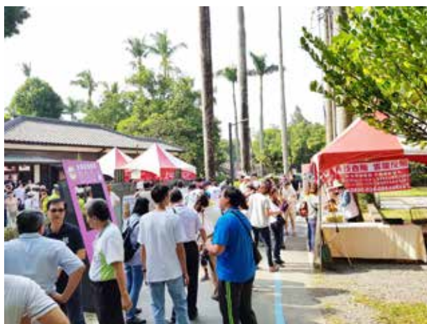
現場人潮洶湧一同反賄選