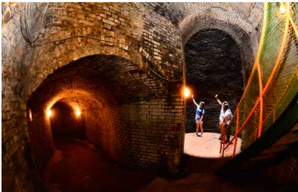
全國唯一的囟底隧道