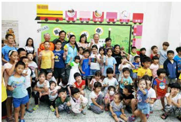
童畫砂糖睦鄰活動讓鄉親們備感溫馨