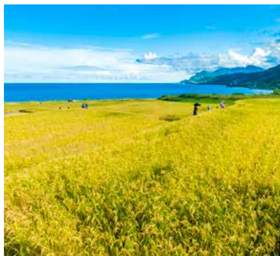
沒有花季的六十石山一樣美麗