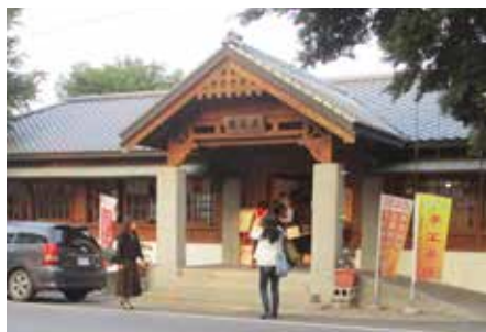
讓灣生充滿回憶的虎尾驛