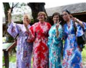
享受花糖的日式風情