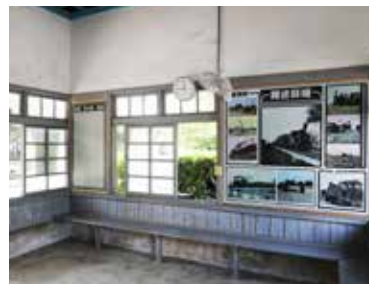
古色古香的蒜頭糖廠車站