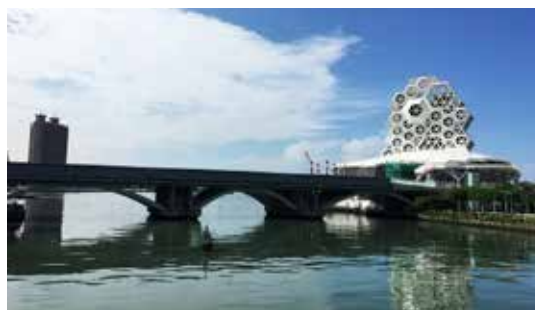
搭輕軌遊高雄輕鬆又愜意

愜意的橋頭糖廠單車微旅行，搭配便捷的高雄捷運、多元的交通方式，讓滾動的車輪帶你走進老樹綠意、日式風情、糖鐵足跡與製糖產業，感受時間之輪流轉的痕跡，二日的高雄之行絕對不會讓您失望。🍁