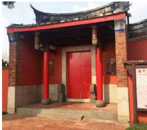
書卷味濃郁的屏東書院