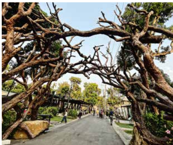
善化糖廠內的裝置藝術