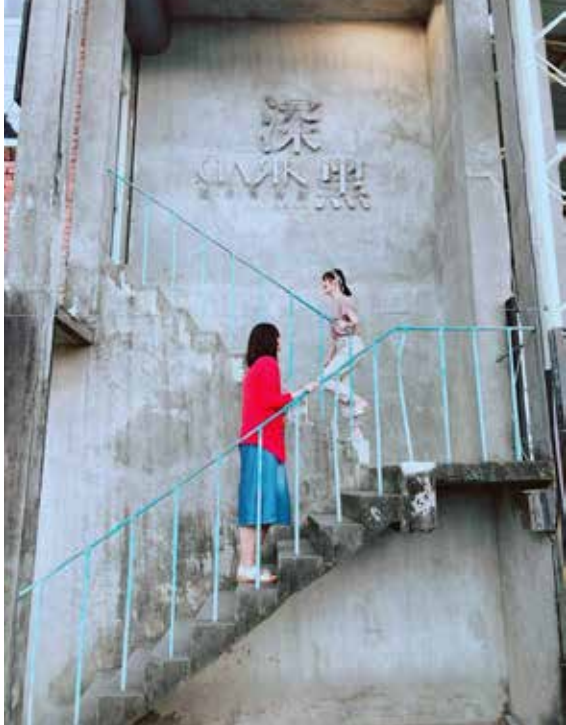
深黑餐廳的石牆設計味十足