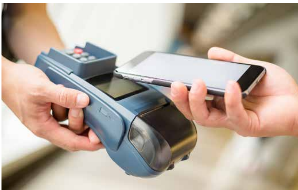
出門不用帶錢包，有手機就能搞定

隨著手機晶片製程與功率耗損的精進，軟體App開發的淋漓盡致，讓滑手機儼然佔據你我生活的大部分時間，據資策會2016年Q2調查，臺灣民眾平均每天花205分鐘滑手機，Comscore研究也指出2016年5月時，使用行動裝置的人數已逐漸超越桌上型電腦人數，在這個趨向底下，行政院長賴清德於2017年11月24日宣布2025年行動支付普及率達90%之政策目標，後續各機關構及商家間亦如火如荼地開辦該項業務。此外，資策會也在2018年1月發布了「臺灣行動支付消費者調查」，指出台灣使用過行動支付的人，在過去2年內從19%提升到39.7%之多。若我們以「技術採用生命週期」的理論來看，臺灣行動支付技術已通過了早期採用者（Early Adopters）的鴻溝