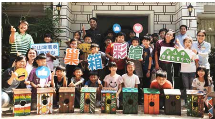
尖山埤環境學習中心偕同新山國小師生打造貓頭鷹的家（巢箱）