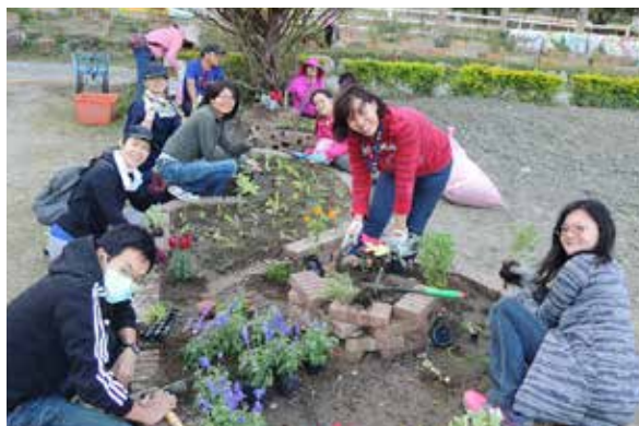
循環農業推廣之花園種植課程

許多學員與遊客一直詢問什麼時候還會再舉辦課程或市集，套句某位夥伴說的話：「不期而遇反而讓人更加期待」，那麼就讓我們一起期待下次活動的舉辦，希望能很快地再相見！🌻