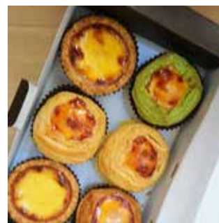
貝林古堡葡式蛋塔