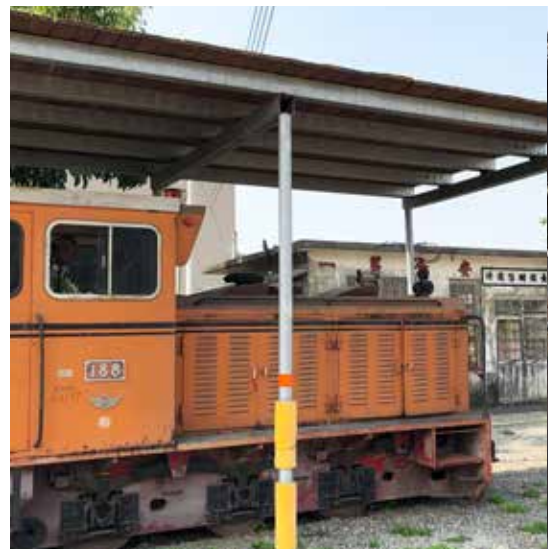
愛的捉迷藏－長短樹信號所