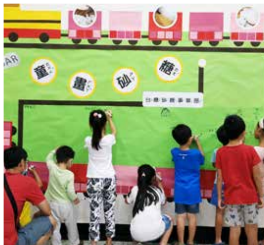
活動既好玩又有趣，孩童樂在其中