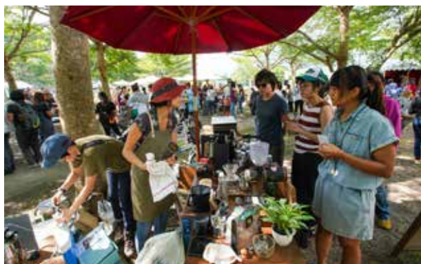
池上牧野渡假村不定期的市集活動