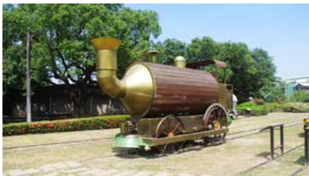
橋頭糖廠內廢鐵改造的裝置藝術

偌大廠區最具有存在感的設施，莫過於製糖工廠的煙囪，無論從什麼角度觀看，都令人佩服前人的工程智慧，尤其橋頭糖廠於1901年設立，是臺灣第一座現代化機械式製糖廠，後來成為各地糖廠的範本。參觀完橋頭糖廠，可以至高雄捷運橋頭糖廠站（R22A），與單車一同搭乘捷運前往鹽埕埔站（O2）或西子灣站（O1），此兩處捷運站皆鄰近「駁二藝術特區」，駁二意指「第二號接駁碼頭」，這裡的大勇、大義和蓬萊倉庫群過往存放著等待出口海外的砂糖，藉由砂糖賺取的外匯，曾佔臺灣外匯收入的70%以上呢！橋頭糖廠與駁二之間的砂糖運輸曾經以鐵路相連，今日，連結兩地的交通工具轉變為捷運，軌道載運砂糖的任務也變成載送人員往來，而橋頭糖廠與駁二皆轉型朝向藝文產業發展，遊走於駁二的文創店家時，別忘了仔細留意倉庫建築，除了能欣賞紅磚倉庫的建築美感，還能在牆上發現「台糖」的標誌，見證了倉庫群的用途轉變。若是意猶未盡可在駁二特區轉搭輕軌列車飽覽高雄港灣美景，