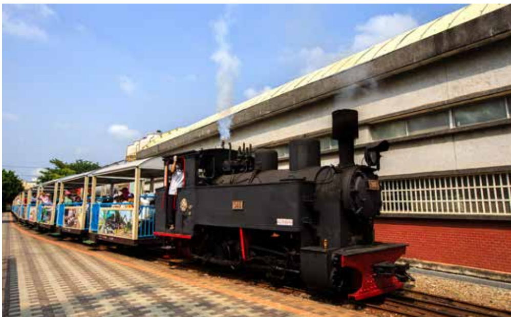
溪湖糖廠的五分車