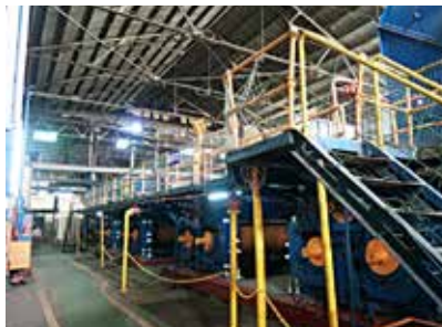
到製糖工場尋找糖金歲月的痕跡