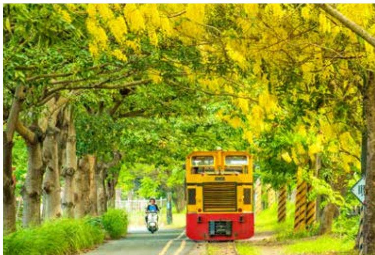
橋頭糖廠旁的黃金隧道