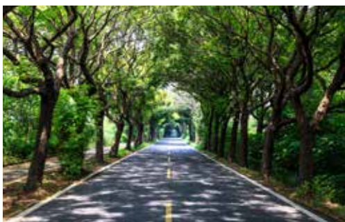
溪湖糖廠旁的樂樹隧道

名，利用牛車於潮間帶採蚵是由日治時期迄今仍使用的技術，運用經特殊訓練與帶著特殊裝備的牛隻「海牛」，至潮間帶進行蚵田養殖及採收作業，芳苑這邊也有許多業者提供蚵農生態體驗，包含蚵田整理、採蚵、洗蚵、現剝蚵仔、挖蛤仔、現煮現烤海鮮等豐富的活動，這樣子的「海牛採蚵」技術在2016年也成為彰化第一個以產業登錄的無形文化資產呢。如果錯過了芳苑的活動或是時間接近傍晚時，也可以到鄰近的王功漁港潮間帶觀賞滿地螃蟹與美麗的夕陽，夕陽灑落在遠方的地平線，實在美不勝收。在離開王功前，也不忘帶著王功有名的新穎口味泉芳枝仔冰，結束一天充實的生態文化之旅。☘