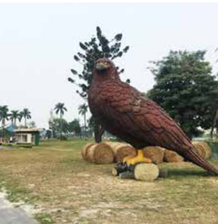
廣闊的縣民公園廣場

高屏舊鐵橋建於1911年，是日治時期亞洲最長的鐵橋，也是目前臺灣唯一列為二級古蹟的鐵橋，前陣子橋下佈滿大片波斯菊花海而成為IG打卡的地標，為了讓遊客深入鐵橋歷史，周邊還以舊車廂改成展示館，值得大家前來一遊。今日介紹了許多景點，希望您能放慢腳步品嚐屏東的人文特色，回程時更別忘了到「民族路夜市」打打牙祭，尋找在地的好滋味。屏東一直是個舒服的城市，還有很多地方無法一一介紹，不囉嗦，來就對了。🍷