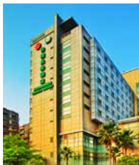
台糖長樂酒店（臺南市區）