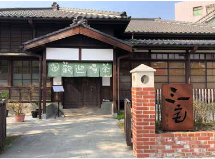
俗女追愛－新營三一宅

興安農場可以觀賞鐵道兩側栽植的各種苗木植物及棲息其間豐富的鳥類與昆蟲生態。園區內的「烏樹林糖業鐵道故事館」、「地震體驗館」也很適合親子同遊，極具教育意義。