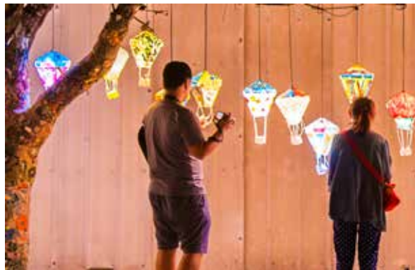
花蓮火車站旁的鐵花村藝術區

臺東是個富含自然資源與文化資源的城市，兩天一夜稍嫌匆忙，只能市區行程加上海線或山線行程，如果有更多的空閒時間，安排三天兩夜的臺東之旅，一定能夠收穫更多！🌸