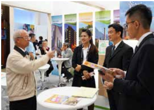
陳董事長與現場同仁分享工作經驗