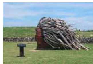
加路蘭風景區的裝置藝術