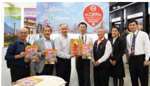
台糖公司總經理管道一(左3)至會場給予同仁打氣