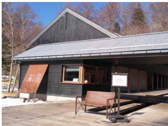
價格親民的星野溫泉