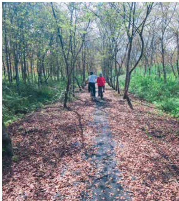
大農大富平地森林園區