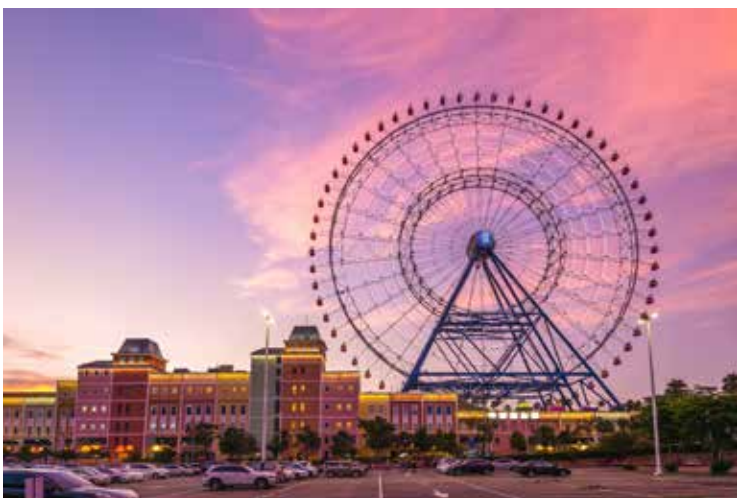
來臺中麗寶樂園享受遊樂園與購物的樂趣