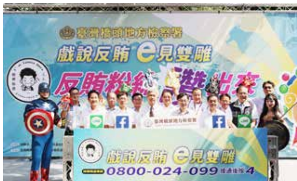
是日與會嘉賓大合影

本次活動主題及場地選定非常成功，在百年糖廠古蹟建築時空背景下啟動e世代雲端反賄，讓民眾加深反賄意識也肯定台糖公司社會參與、敦親睦鄰的優質企業形象，是一次帶動社會廉潔的正能量，難得的檢、調、廉三大合體反賄活動。🌟