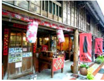
菁寮社區的懷舊風情