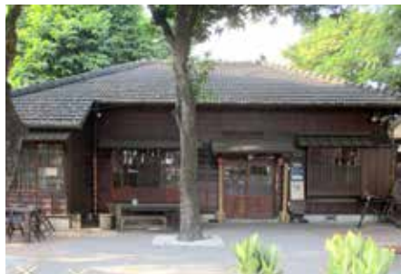
雲林故事館是虎尾地區藝文的聚集地