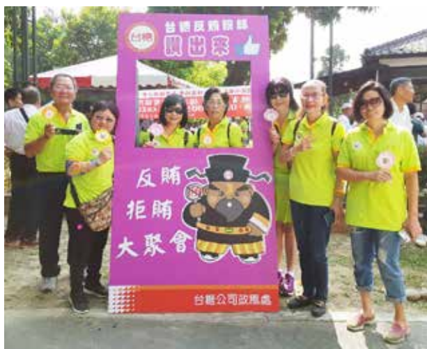
台糖反賄粉絲打卡照