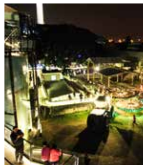
仁德糖廠十鼓園區之夜景