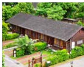
值得一住的花糖日式木屋