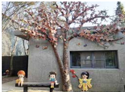
板陶窯的藝術品深受旅客歡迎