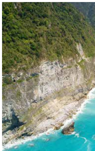
美麗的東部海岸線