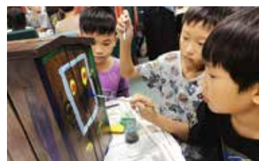
渡假村動物巢箱由學童進行彩繪

在尖山埤的寧靜夜晚，遠處傳來「嗚～嗚～嗚～」的鳴叫聲，這是什麼生物呢？原來是有圓圓大眼睛的領角鴉。又聽見「噓～噓～噓～」的聲音，是誰在吹口哨呢？哇！這是有可愛黃色嘴喙的黃嘴角鴉喔！尖山埤擁有豐富的淺山生態環境，除了領角鴉及黃嘴角鴉外，近期還在園區觀察到稀有保育類褐鷹鴉的蹤跡！