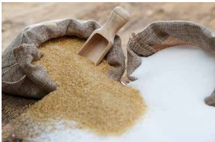
台糖糖品用心經營值得國人信任