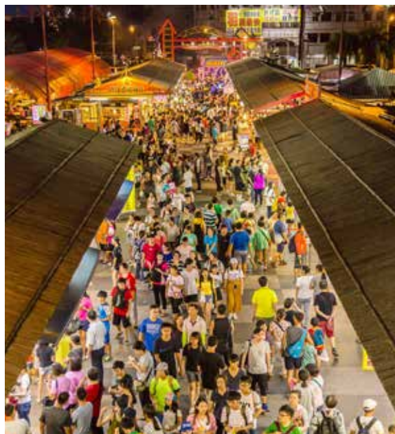
來花蓮夜市享受美食