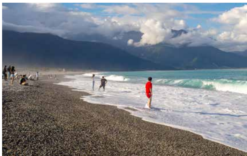
一望無際的七星潭

隔天一早可前往「大農大富平地森林園區」，入園筆直的公路直通遠方的海岸山脈，被譽為花蓮版的伯朗大道，依季節轉化而規劃的圖騰花海及藝術造景，吸引遊客在此流