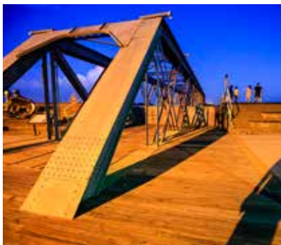
迷人的虎尾鐵橋暮色