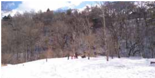
一望無際的雪國風情