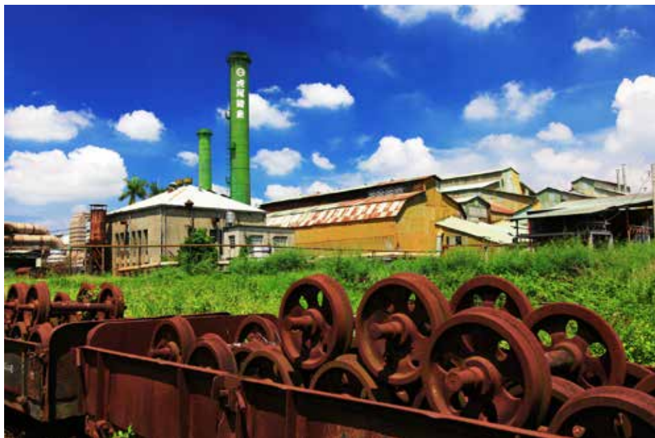
瀰漫糖香與文化風情的虎糖