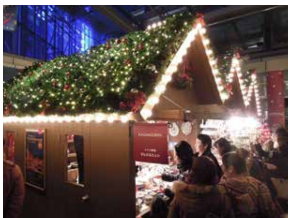
聖誕木屋讓輕井澤更有味道