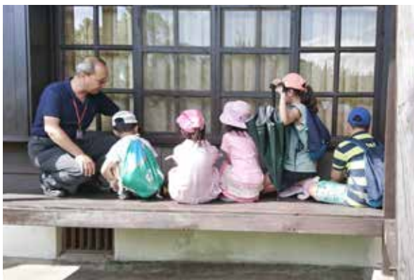
帶領孩童認識花糖的一磚一瓦