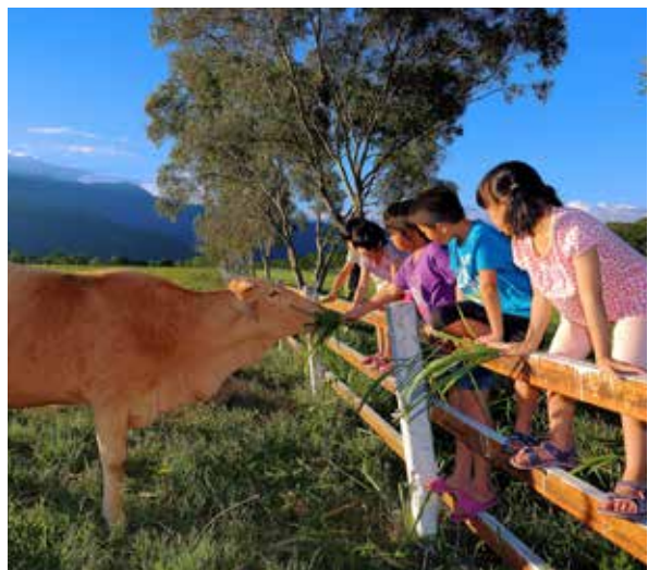
池上永續農場是小朋友的最愛