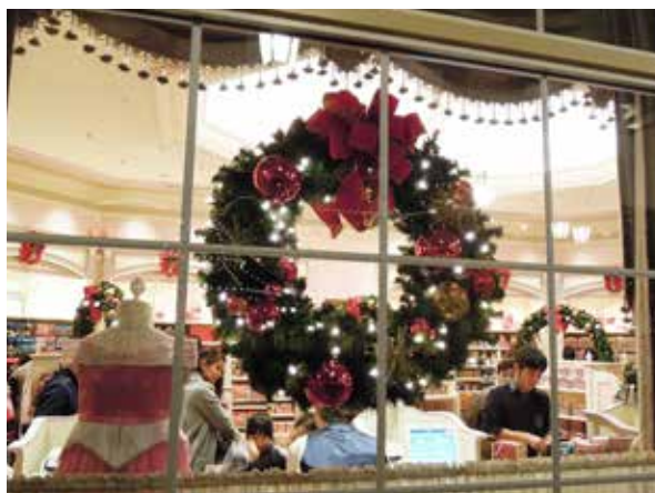
充滿聖誕氣氛的小店