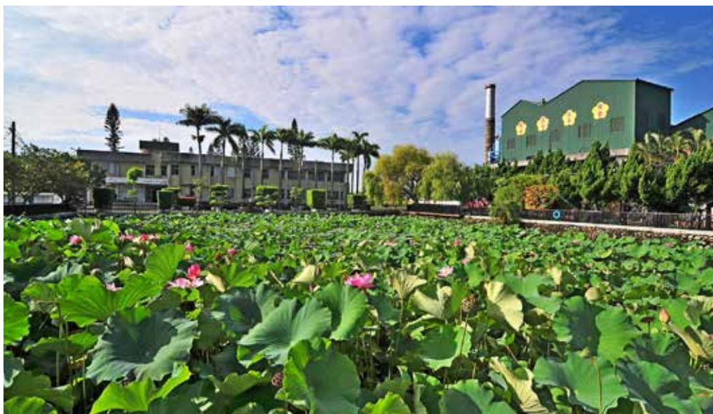
台東糖廠之荷花池