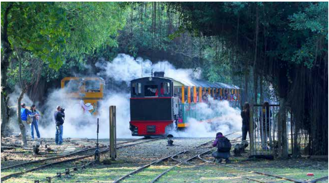
烏樹林鐵道文化園區是鐵道迷的最愛

離開這裡當然不能免俗到「關子嶺」洗個溫泉，關子嶺溫泉區位於白河鎮東側，四周有枕頭山、虎頭山等群峰環抱，環山風景點以關子嶺鹼性溫泉為起點，沿途有紅葉公園、水火同源、碧雲寺、大仙寺等，關子嶺溫泉也列入全臺五大溫泉之一，是相當天然的養生之泉。以上景點構築一條繽紛的旅遊帶，希望大家玩得盡興，建議這裡安排兩日之行，才能對糖業文化、自然生態、人文教育有更多的認知與充實，留下完美的印象之旅。🍄