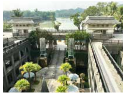
夜宿江南度假村享受湖光山水

利號、成功號」，讓睽違30年的明星火車及台糖客車，風華再現、重出江湖，讓大家一同來重溫舊夢。