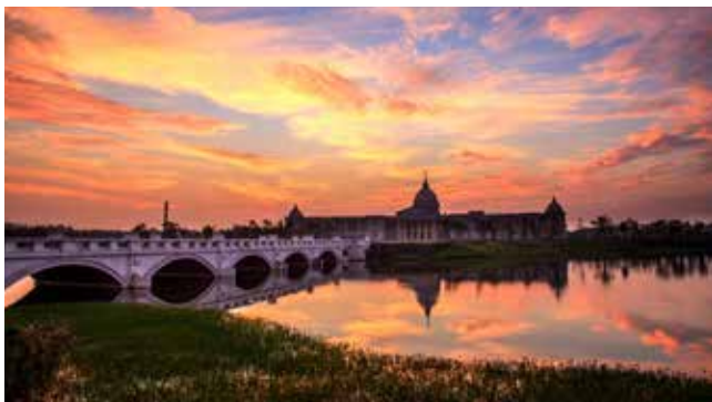
奇美博物館的黃昏