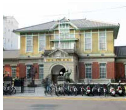
布袋戲迷必訪的雲林布袋戲館

，如蔗種改良紀念碑、虎尾糖廠改製特砂糖紀念碑、臥龍山石碑及鯉魚池等，值得前來遊園緬懷。