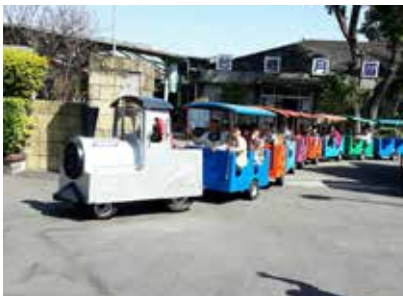
搭乘小火車趴趴走