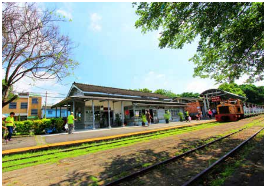
蒜頭蔗埕文化園區