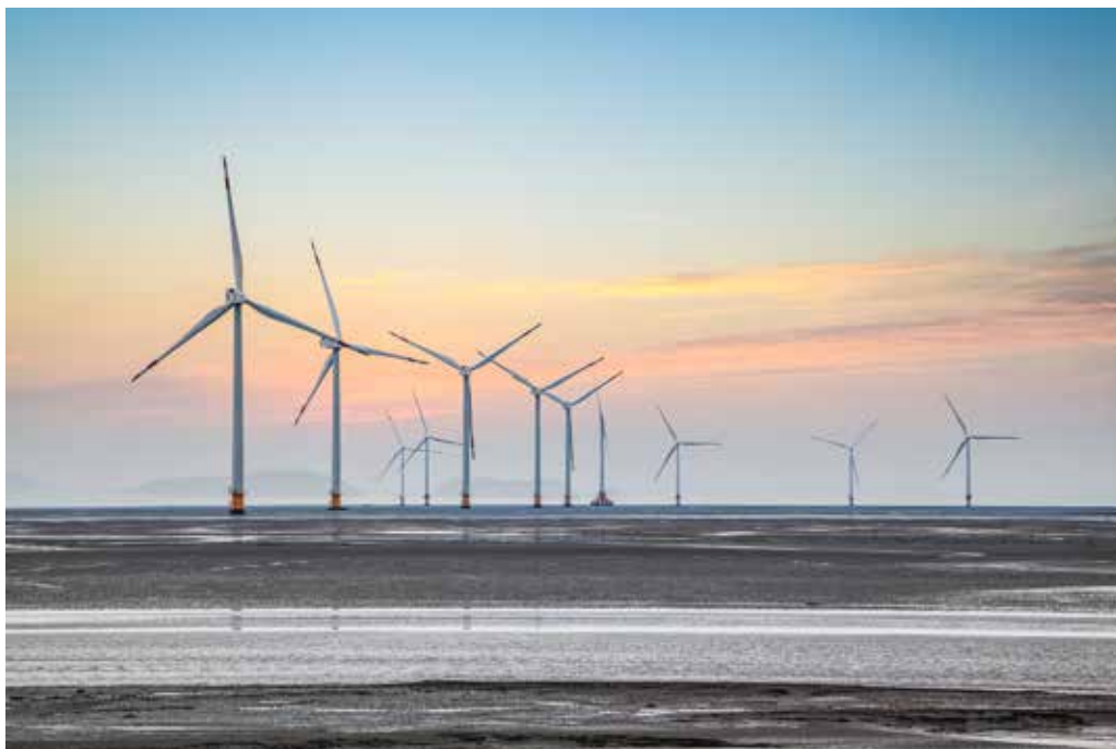
風電時代來臨，邁向綠能新紀元

臺灣正式邁入離岸風電時代。國內首座民營離岸風電海洋示範風場（Formosa 1）將於今年年底營運，台電示範風場、海能風電、達德允能、沃旭風場接棒登場，年底陸續搶開工。