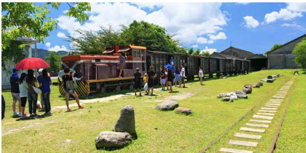
花糖3號倉庫前是遊客拍照打卡的好地方

沿著美麗的花東縱谷一路南下，如果適逢週末假期，可以探訪位在鳳林鎮，隱身於森林之中的「鷺鷥咖啡」，通過蒼綠的落羽松步道，彷彿闖入童話小鎮，四周是充滿藝術感的特色建築，異國風情與這片諾大的庭院搭配的相得益彰，最吸引人的是座森林迷宮，走在裡頭就如童話裡的主角一般，探索著神祕又美麗的境界，而迷宮的盡頭是棟造型奇特的童話小屋。來到此處，不用出國旅遊也能享受漫遊歐洲小鎮的感覺。