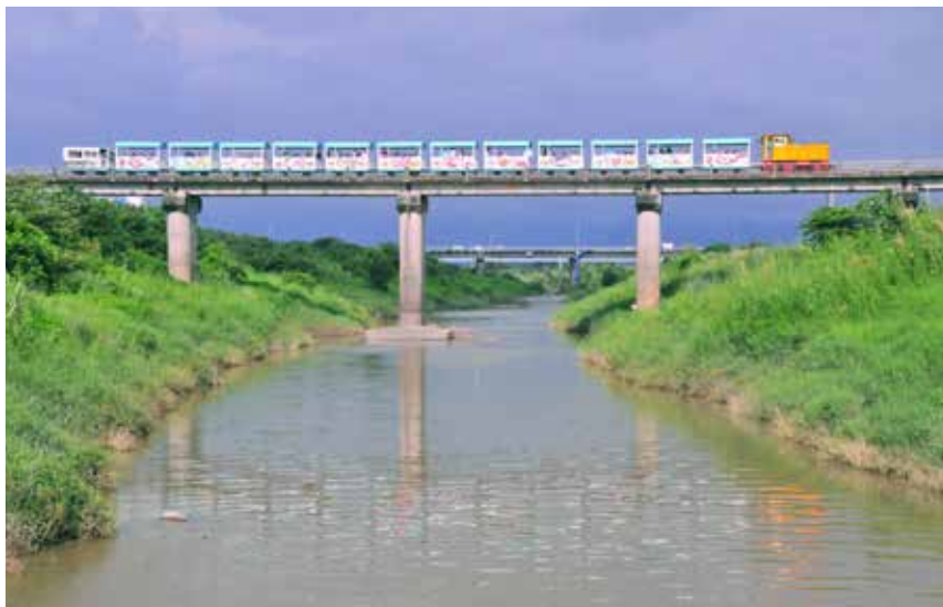
來趟五分車的知性之旅