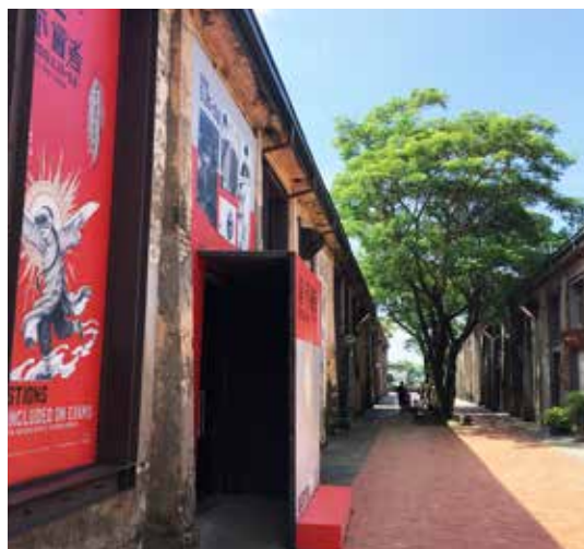
駁二文創藝術特區