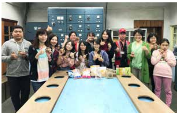
課程圓滿結束學員合影留念

本次講座活動讓民眾走進花蓮觀光糖廠，瞭解在地的歷史，藉由珍貴的糖業檔案加深記憶，珍惜與守護在地文化資產；也透過手作體驗深刻感受製糖的過程與辛苦，不只將親手製成的黑糖帶回家，也將滿滿的故事與回憶一併珍藏。🍬