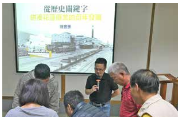
鍾書豪老師與學員互動熱烈

「檔案故事X糖廠記憶之甜」系列講座共分為北、東、南三場次，首場在臺南烏樹林休閒園區舉行，以「五分仔車講古」為主題，並有搭乘五分車與台糖鐵道文化博物館導