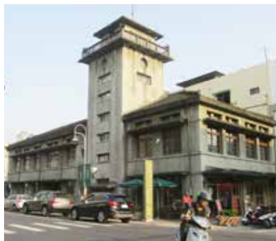
誠品進駐的虎尾合同廳舍