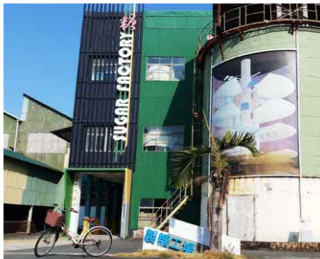
糖博館的製糖工場