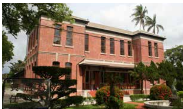
藝文空間眾多的總爺糖廠

第二天來到仁德糖廠附近的「虎山林場」，原為仁德糖廠所屬的虎山農場，在糖廠停閉後轉變為造林地，種植不同樹種，現已變為林蔭濃密的森林，不同季節展現多變的樣貌，是居