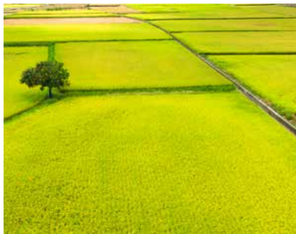
菁寮的無米樂稻田