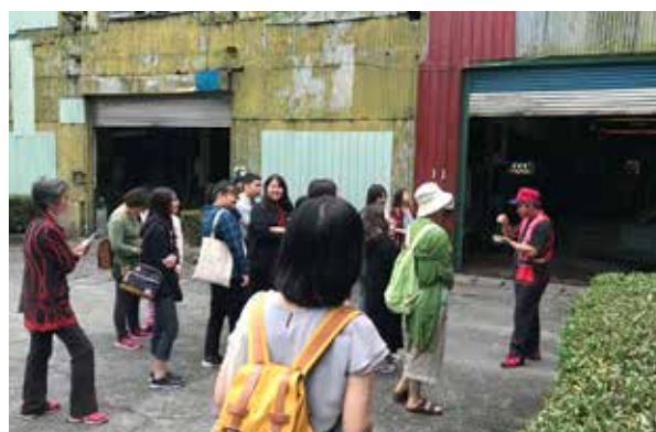
導覽員進行園區導覽解說

覽；北區舉行地點在臺北糖部A倉文化教室，與民眾分享「集體記憶與社區運動—臺北市糖·社區的個案」，還有非常特殊的甘蔗製紙活動體驗與糖部文化園區導覽；東區場次特選定花蓮觀光糖廠辦理，在歷史悠久、檜木飄香的日式木屋會議室內進行專題分享，結合製糖體驗與花糖文化導覽。