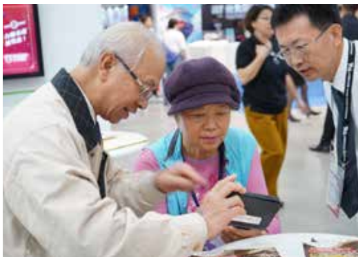
陳董事長為民眾解說展品之內容

點心餐廳餐券等優惠促銷方案廣獲消費者喜愛，活動現場更提供拉霸機抽獎活動，凡消費即可獲得台糖保健產品及文創商品，還有機會免費抽中台糖聯合住宿券乙張，普獲消費者青睞，銷售住宿券及餐券之餘，增加台糖產品宣傳曝光，並藉由與消費者互動過程，瞭解市場趨勢及需求，一舉數得。