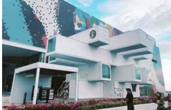
全臺唯一貨櫃星巴克

花蓮還有許多適合全家大小一起同遊的美麗景點，您可以造訪原住民部落，或是到「六十石山」一遊，就算錯過花季景色依舊迷人，或是到太魯閣國家公園體驗山谷風情，喜歡海水就到「七星潭」放空一下，想要熱鬧的感覺就前往往花蓮市區走走，探訪當地特色小店與土產，然後再到觀光夜市尋找美食，讓整個行程滿載而歸。花蓮還有訴不完的人文故事隱身其中，唯有漫遊在這片土地，才能體會到它的真正溫度，現在不管您想來二天或三天，快快起身規劃這段慢活行程吧！☘