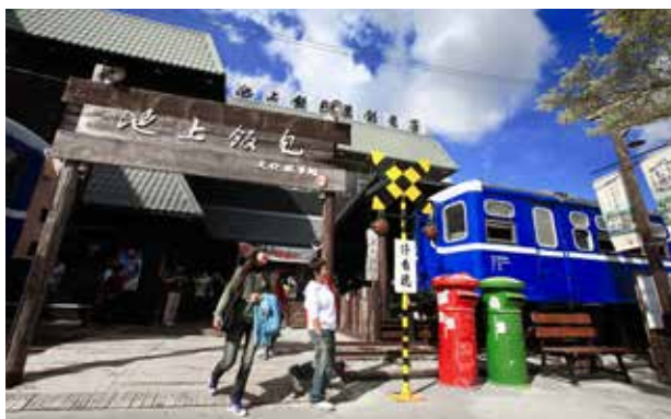
遠近馳名的池上飯包

當您騎著腳踏車徜徉在園區，那觸目的翠綠與質樸，映襯著藍天白雲，躺在草原上，爬上牧草捲，留下的不只是香草氣息，更是未來的甜美回憶！臺灣很美，臺東更是，您有多久沒有遠離塵囂讓自己及家人好好的沈澱一下？您有多久沒有聞到空氣中帶著清新甜味？建議大家來池上牧野渡假村住一晚，相信一定可以滿足想放鬆的您，與家人盡情在牧草區奔跑及放空，享受與大自然共生的存在感，現在就開始與朋友家人一同規劃，讓久處空污的都市人享受兩天一日的清「肺」之旅！🍃