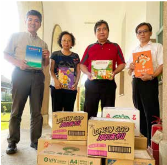
台糖人愛心不落人後，讓書香飄滿偏鄉

面對少子化及鄉村人口外移趨勢，國內許多小學面臨被動併校、縮班或裁撤情形，位於雲林縣與嘉義縣交界的文正國小即是這股潮流影響學校之一，該校目前僅6個班級共48位學童就讀，雖然學校資源不足，但為能協助學童營造書香家庭環境，培養與家人一起閱讀的興趣，進而提高讀書風氣，該校於本（108）年10月份發起「家庭閱讀角設計比賽」活動，規劃提供每位在校學童20冊繪本、橋樑書、科普書、少年小說等適合兒童閱讀書籍，協助其與家人共同在家中布置一個讀書角落，營造舒適讀書環境，並訂定1個月時間內蒐集1000本二手書籍目標，但在偏鄉資源缺乏下，如何達成這個數量是個極大的挑戰。