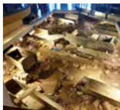
卑南文化史前遺址公園

落附近有一間名叫「Funky」的巧克力莊園，老闆在當地親手種植可可，並研發出許多不同口味的巧克力，不僅外型精美，口感也相當雅緻。品嚐美食之餘，別忘了到鹿野鄉龍田村的區役所及鹿野神社走走，欣賞日式建築之美。走訪完鹿野鄉之後，再到池上伯朗大道，欣賞稻穗之美。住宿推薦池上牧野渡假村，不僅可以搭乘遊園小火車參觀園區，看看放牧在草原上成群的牛羊，還有另外七種草食性的野生動物，生態相當豐富。