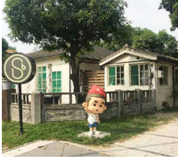
由眷村改造的勝利星村創意生活園區

成，四周綴點草皮，紅綠相間可見古之幽情。屏東孔子廟的格局雖不大，然傳統工法細緻，模樣樸素蕭蕭，頗具書院特質，為一處不可多得的古蹟。