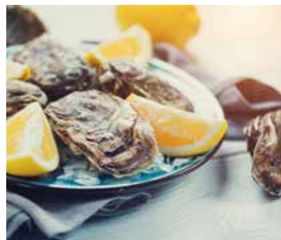
讓人食指大動的鮮蚵