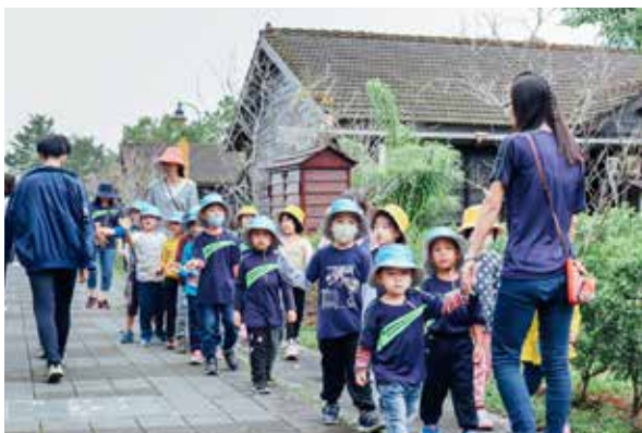
花糖故事說不完，具有環境教育的價值

台糖公司花蓮糖廠自91年離蔗後逐步轉型成為觀光糖廠，以觀光休憩的產業嶄新面貌經營，近年來成立「花蓮觀光糖廠環境教育學習中心」，積極朝向環境教育場所認證發展，在追求經營績效時服膺環境保護的重要使命。此次獲獎「國家環境教育獎」為行政院環保署鼓勵其全民參與，並表彰有功團體及人士對環境教育的貢獻，將歷年所推動的環境教育事蹟作為全國、縣市模範，今年邁向第七屆，深獲環境教育深耕人士肯定，花糖的環境教育架構建立在核心特色—「糖」與四大領域之上。以「糖」為核心，串聯與糖業相關的四大主題，以舊