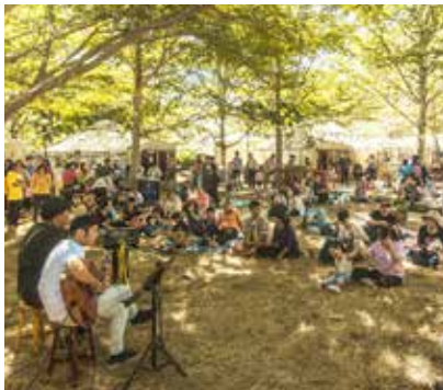
大受歡迎的草原音樂會