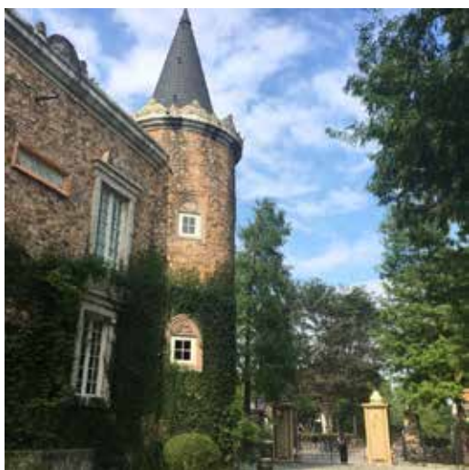
鸞鷲咖啡—雪雲城堡