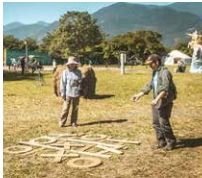
遊客盡情在市集玩遊戲