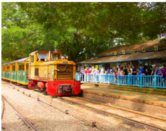
烏樹林五分車出發囉