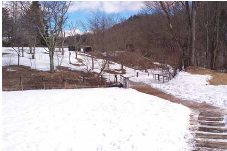
不必上滑雪場路邊的景致就很漂亮

如果您喜歡在聖誕時段感受銀白色的雪景，又不想長途跋涉跑到深山，有個地方是不錯的選擇，那就是位於日本長野縣的「輕井澤」。本次旅程與好友二度造訪，第一回到輕井澤是夏天，涼爽的氣候暑意全消，難怪是日本著名的避暑勝地。在輕井澤的教堂結婚是許多日本年輕人的夢想，很多明星選擇在此完成終身大事。夏天至輕井澤適合騎腳踏車，可省下等候公車的時間。冬天的輕井澤使人誤以為身在北歐，尤其是11至12月，濃濃的聖誕氣氛更讓人以為身處歐美。跑來這裡滑雪的人更多，著名的「王子飯店」就在滑雪場附近，交通、住宿皆便，適合第一次自助滑雪的人。