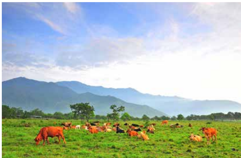
來池上牧野渡假村與大自然親近