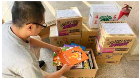
二手書整理後讓資源再次利用

觀察本次所募集二手書中，不乏價值不菲之精美套裝書及系列叢書，足見同仁對兒童閱讀教育之重視及投入，而在家中小孩成長至另一階段後，捨愛將這些書本交給另外需要的人，做到了知識永續傳達，價值無限提升，這是循環經濟最終目的，此外，在各單位齊力協助下，能為偏鄉學童圓夢，是本次活動最大之意義，亦是台糖人愛心不落人後另一表現。🍀