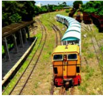
新營觀光五分車出發囉