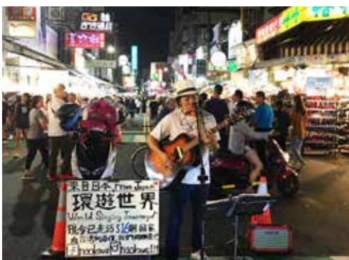
來趟文化夜市的美食之旅