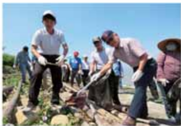
台糖淨灘 守護台灣

製糖廠地的前身為台糖所屬蔗地，由於擁有相當多樣的環境多樣地型，每年都有許多稀有鳥類在此棲息過冬。為保護這片重要濕地，環保署發起淨灘活動，台糖公司優先響應，期望透過持續性的淨灘活動，提升員工環境教育的素養，並融入生活之中。