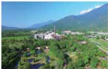
大農大富平地森林園區

大農大富位於花蓮光復鄉，最早是台糖甘蔗田，西元2002年林務局與台糖合作進行平地造林，栽來20種台灣原生樹種，經過100萬株樹苗，一株一株，慢慢種進土地裡，10年後的今天生態復甦已見成跡，森林深處起碼50種鳥類，更已吸引7種螢火蟲，每年3、4月的螢火蟲季，景觀如夢似幻。