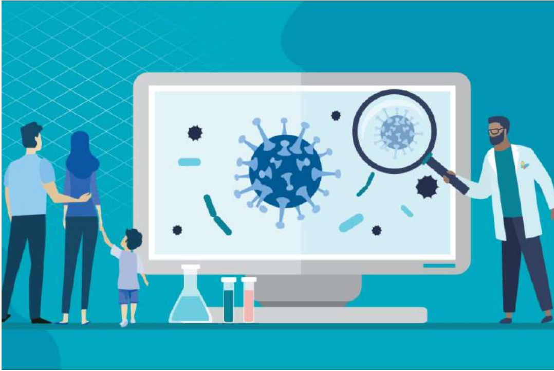
圖/Children's Hospital Los Angeles